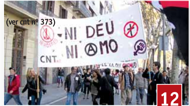
(ver cnt nº 373)