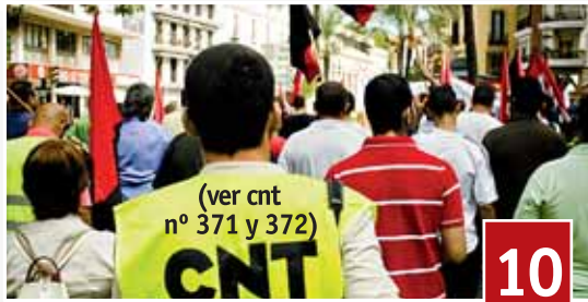
(ver cnt nº 371 y 372)

La interminable cifra de parados, la reforma laboral o el recorte en las pensiones, fueron algunos de los temas candentes en esta cita histórica dentro del movimiento libertario y del movimiento obrero mundial, la cual lejos de ser un acto simbólico, vuelve a ser poco a poco ese acto contestatario y multitudinario que siempre ha de ser, y en las filas de la anarcosindical se puede apreciar como ese aumento en sus movilizaciones va a más. Como siempre, hicimos un reportaje amplio de las diferentes movilizaciones del sindicato por cada rincón del Estado español.