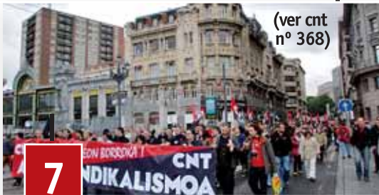
(ver cnt nº 368)

A través de una serie de reportajes, en las páginas del cnt se ha ido realizando un seguimiento de la implantación de la CNT en diferentes sectores laborales, para de esta forma, compartir las diferentes experiencias y demostrar que la organización, y esa otra forma de hacer sindicalismo que propugnamos, no sólo es posible sino que es absolutamente necesario. El sector aéreo, forestal, de la arqueología o de la intervención social es un ejemplo de ello.