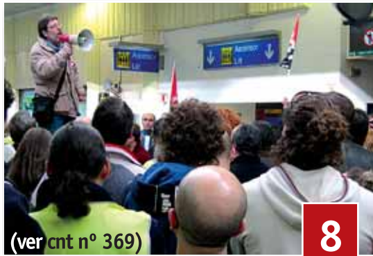
(ver cnt nº 369)