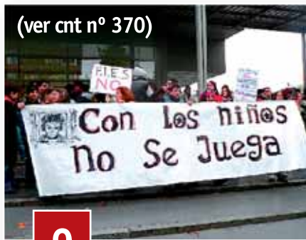
(ver cnt nº 370)

La CNT se sumó a la huelga desde una postura crítica con CCOO-UGT. Pese a ello, los hombres y mujeres de la anarcosindical se dejaron el pellejo en el éxito de la misma. Allí donde hubiera un piquete, una concentración, una manifestación, han estado los militantes de la CNT y han contribuido a su extensión y radicalización. En las páginas del cnt dimos buena cuenta de ello a través de varios reportajes. Por supuesto, las movilizaciones no terminan aquí sino que para el sindicato suponen un punto de partida para tumbiar la reforma laboral y los sucesivos recortes del gobierno.