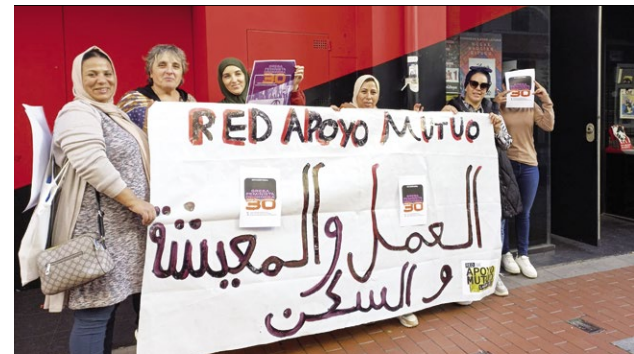
Compañeras a la puerta de la sede del sindicato en Barakaldo durante la huelga feminista del 30N.