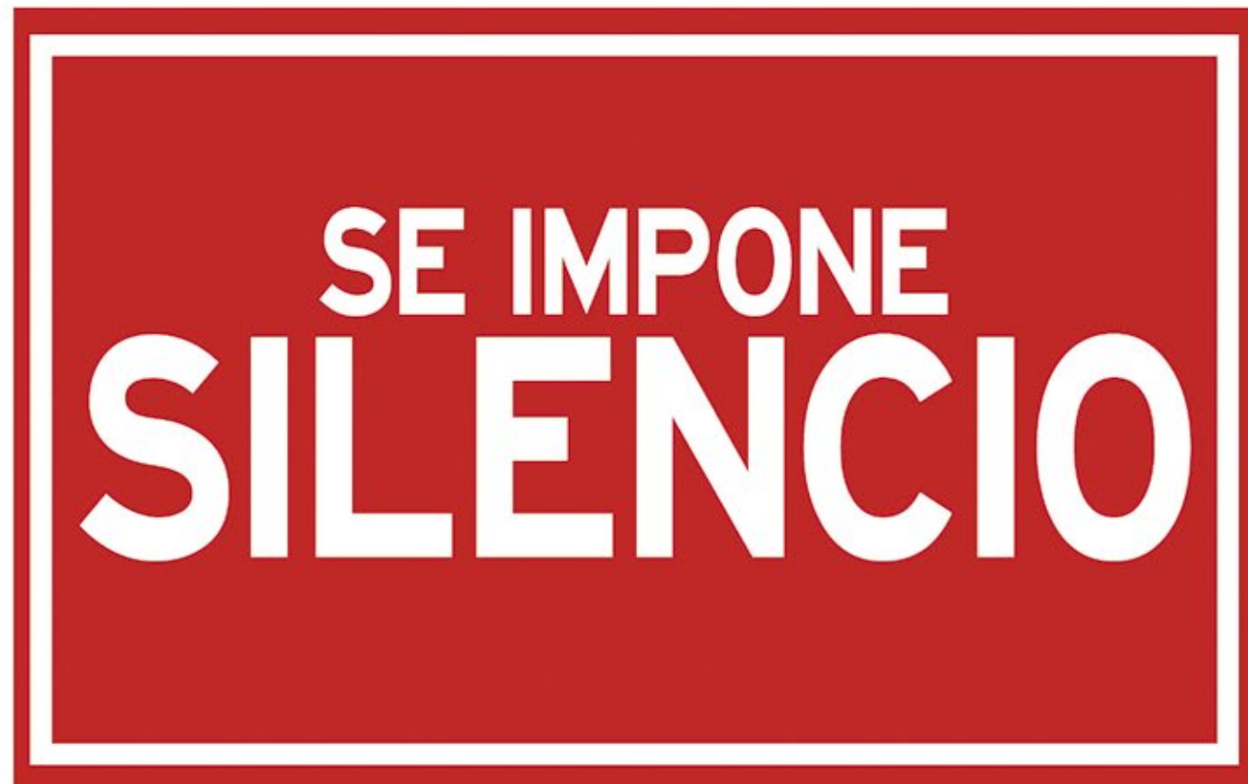
Ley Mordaza desde 2015