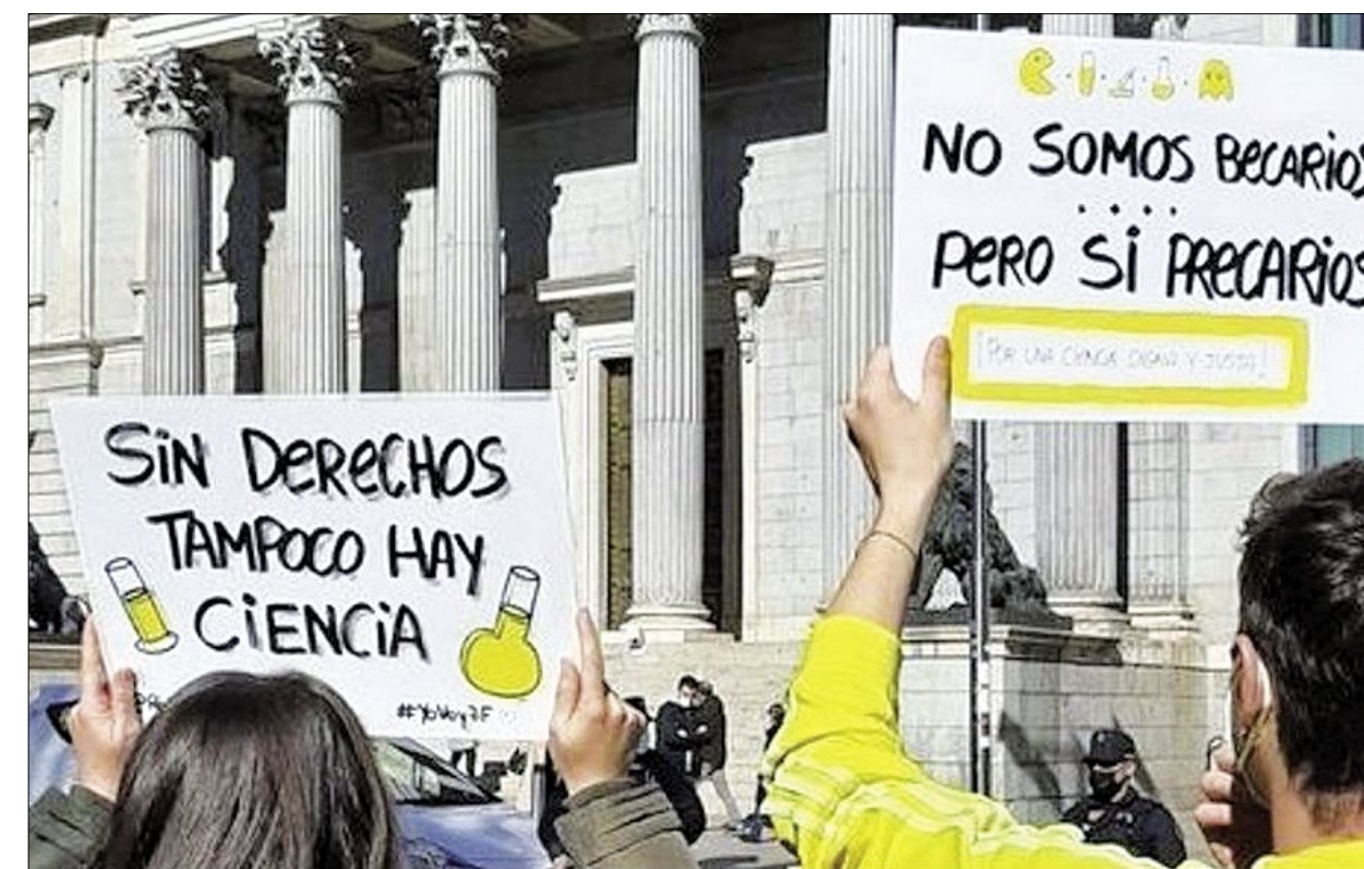
Concentración frente a las cortes de Jóvenes Investigadores frente a las Corte en 2022.

Desde CNT, se muestran positivos ya que consideran factible que un tribunal les de la razón, ya que cuentan con sentencias de juzgado en este sentido en el pasado.