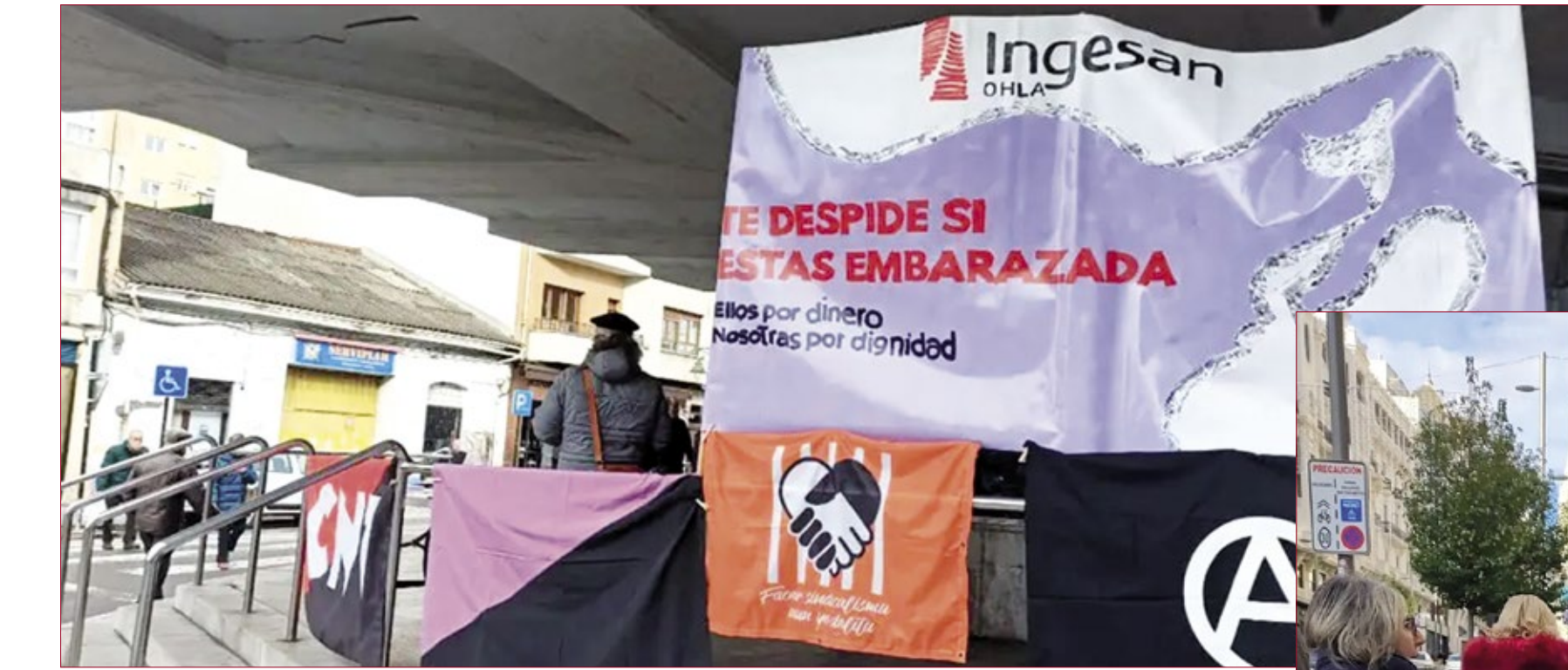
Dos momentos de la lucha de las trabajadoras de ayuda a domicilio por su dignidad.

Sus demandas incluyen también el desacuerdo con el kilometraje para las trabajadoras de zonas rurales, ya que, estas trabajadoras utilizan su propio coche para desplazarse de un domicilio a otro. Las empresas utilizan el "método google" para abonar la cuantía de kilometraje que no es otro que calcular los kilómetros a través de GOOGLE MAPS teniendo en cuenta que google maps en ciertos lugares no reconoce las carreteras rurales y que éste no tiene en cuenta imprevistos de animales, semáforos o tráfico. Esta situación ha repercutido degradadamente también en los dependientes puesto que los nuevos convenios de los ayuntamientos han decidido restarles a las