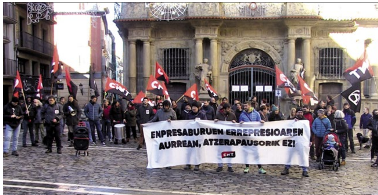
Concentración sindical en la Plaza del Ayuntamiento de Pamplona.

Se ha querido criminalizar nuestra actividad sindical, y esto es así porque allá donde nadie defiende a la clase trabajadora, está la CNT. Con l@s precari@s, con l@s migrantes, contra la temporalidad, contra la dominación del caciquismo y de la explotación.