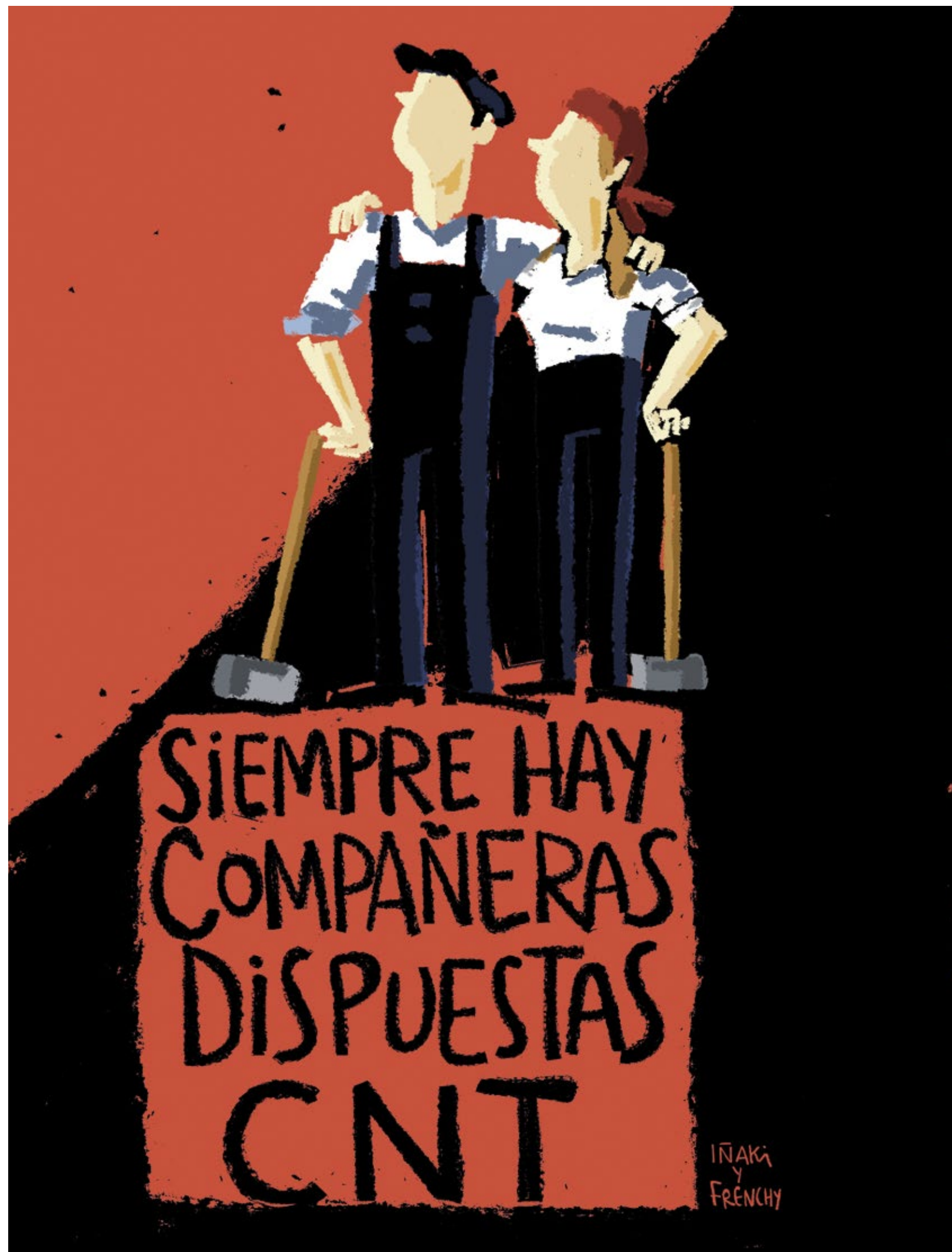
IÑAKI Y FRENCHY