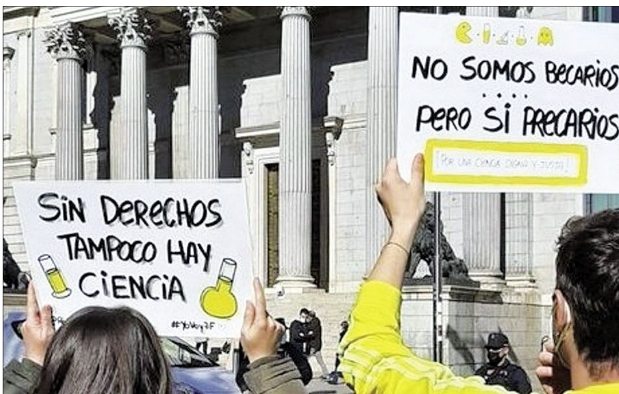
Concentración frente a las cortes de Jóvenes Investigadores frente a las Corte en 2022.

Desde CNT, se muestran positivos ya que consideran factible que un tribunal les de la razón, ya que cuentan con sentencias de juzgado en este sentido en el pasado.