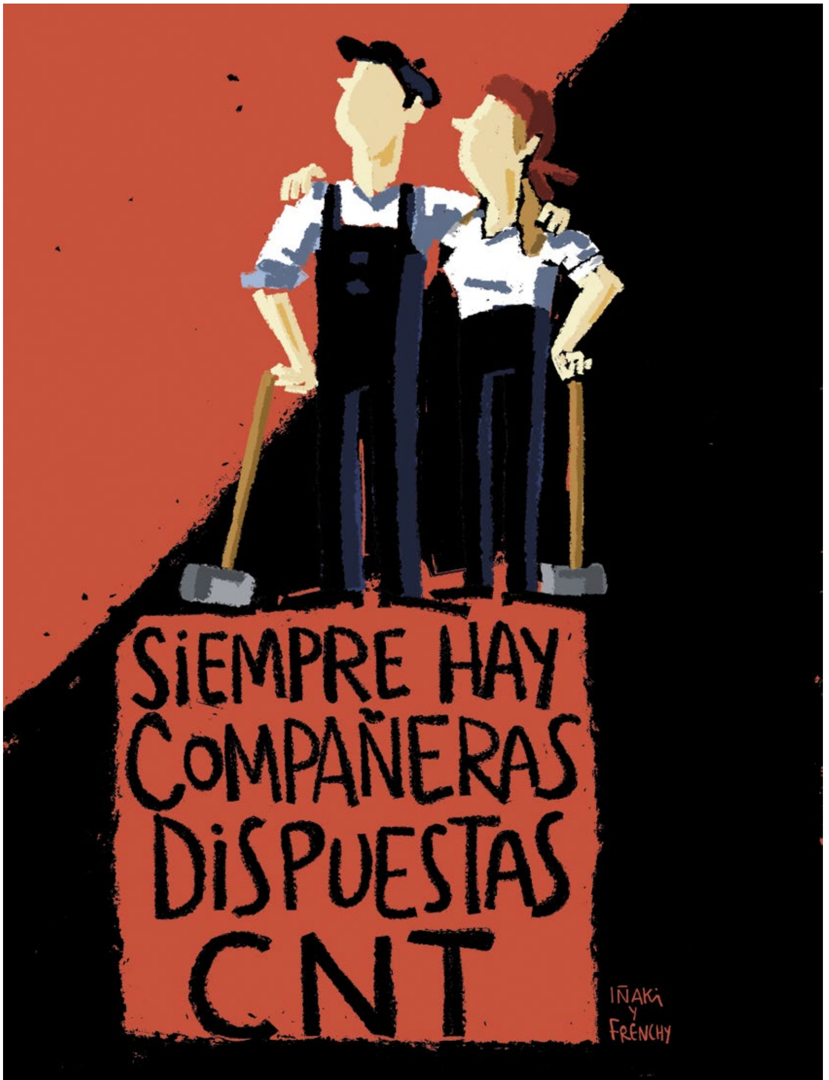
IÑAKI Y FRENCHY