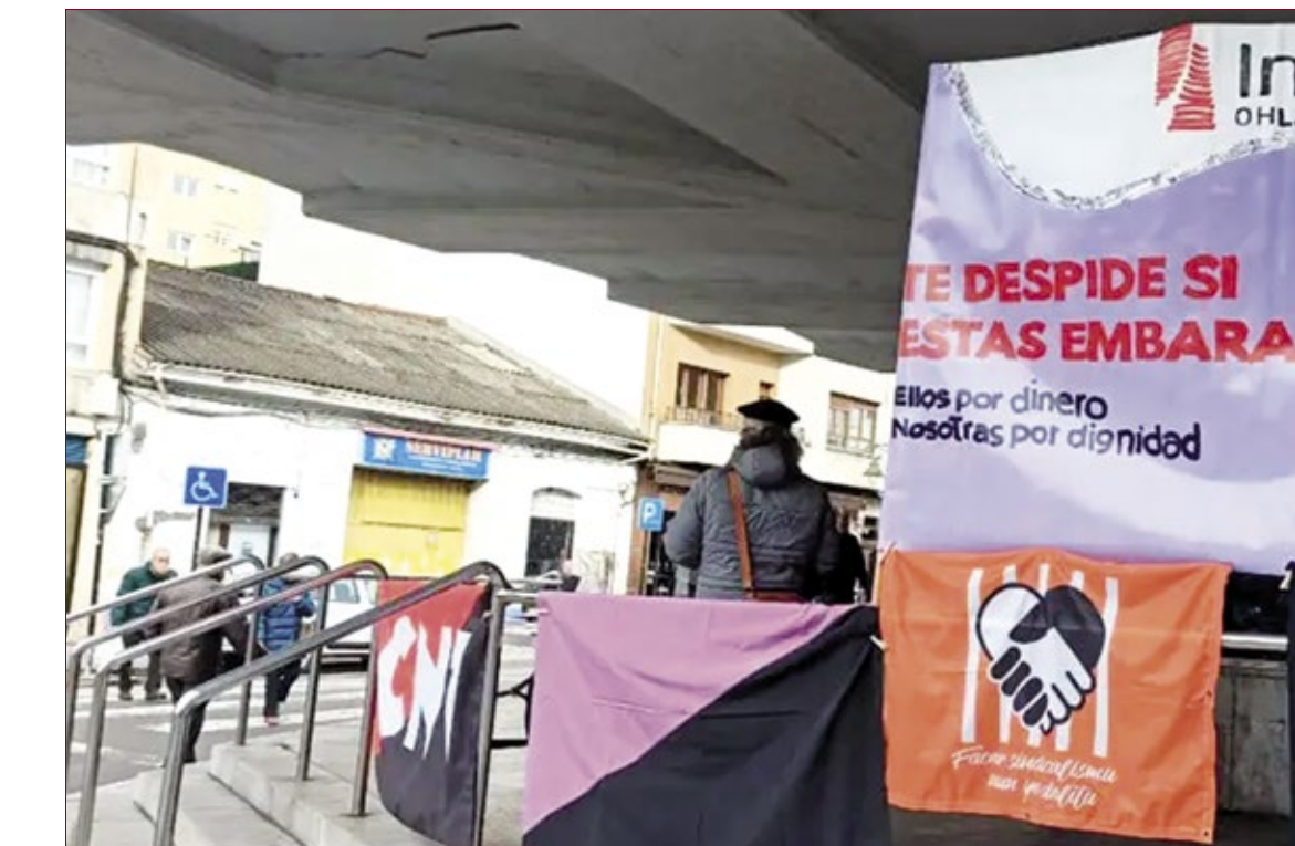
Dos momentos de la lucha de las trabajadoras de ayuda a domicilio por su dignidad.

Sus demandas incluyen también el desacuerdo con el kilometraje para las trabajadoras de zonas rurales, ya que, estas trabajadoras utilizan su propio coche para desplazarse de un domicilio a otro. Las empresas utilizan el "método google" para abonar la cuantía de kilometraje que no es otro que calcular los kilómetros a través de GOOGLE MAPS teniendo en cuenta que google maps en ciertos lugares no reconoce las carreteras rurales y que éste no tiene en cuenta imprevistos de animales, semáforos o tráfico. Esta situación ha repercutido desgraciadamente también en los dependientes puesto que los nuevos convenios de los ayuntamientos han decidido restarles a las