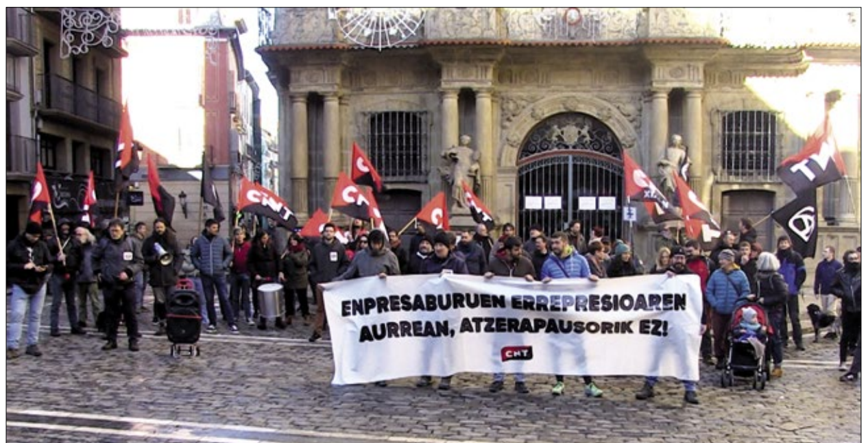
Concentración sindical en la Plaza del Ayuntamiento de Pamplona. / CNT IRUÑA

Se ha querido criminalizar nuestra actividad sindical, y esto es así porque allá donde nadie defiende a la clase trabajadora, está la CNT. Con l@s precari@s, con l@s migrantes, contra la temporalidad, contra la dominación del caciquismo y de la explotación.